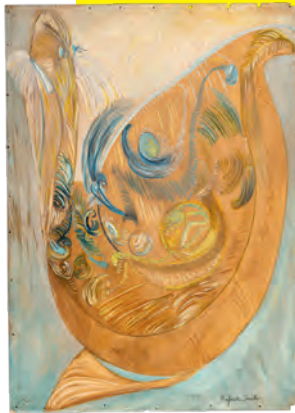
FRIEDA KÖHLER [Pseudonym], „Befreite Seele“/“Liberated soul”, vor / before 1992, Inv. 8594/1 (2021)