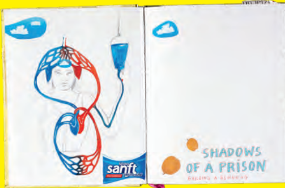
ISABEL SCHUBERT, „Skizzenbuch aus der Psychiatrie“ / “Sketchbook from the psychiatric ward”, 2019, Inv. 8639/1 fol. 19 verso / fol. 20 recto (2023)