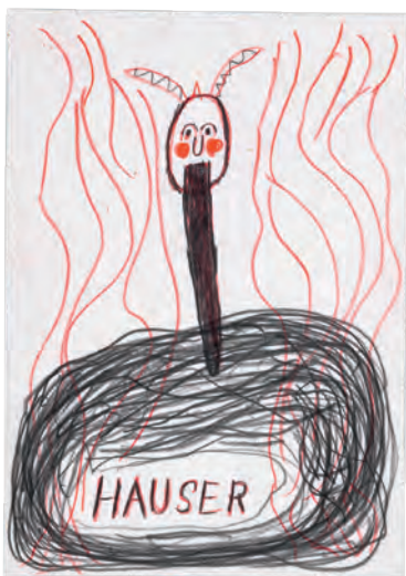
JOHANN HAUSER, ohne Titel [gehörnter Kopf mit langem Bart]/untitled [Horned head with long beard], vor / before 1996, Inv. 8633/2 (2005)