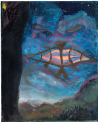
THOMAS WAELTER AKA KOLJA RAIC KOHNEN, ohne Titel [nächtliche Erscheinung]/untitled [nocturnal appearance], 2006, Inv. 8557/1 (2017)