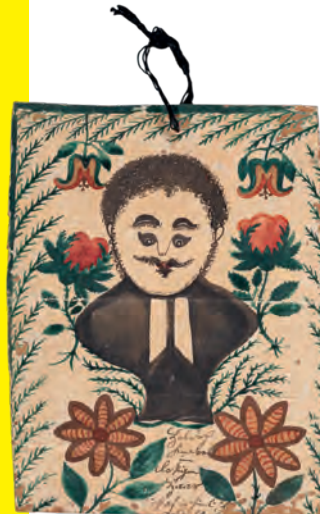
ANONYM, „Holder Knabe im lockigen Haar“ / “A handsome boy with curly hair”, undatiert / undated, Inv. 8496/1 (2007) recto