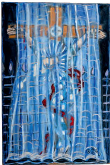
RUDOLF ROTHE, ohne Titel [Kreuzigung]/ untitled [Crucifixion], 1970?, Inv. 8549/52 (2021)