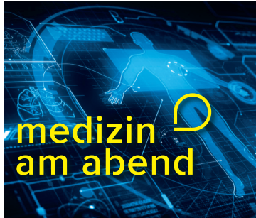
UKHD in Kooperation mit der Rhein-Neckar-Zeitung

SONNTAG, 06.10.2024 | 11:00 UHR (EINLASS AB 10:30 UHR)